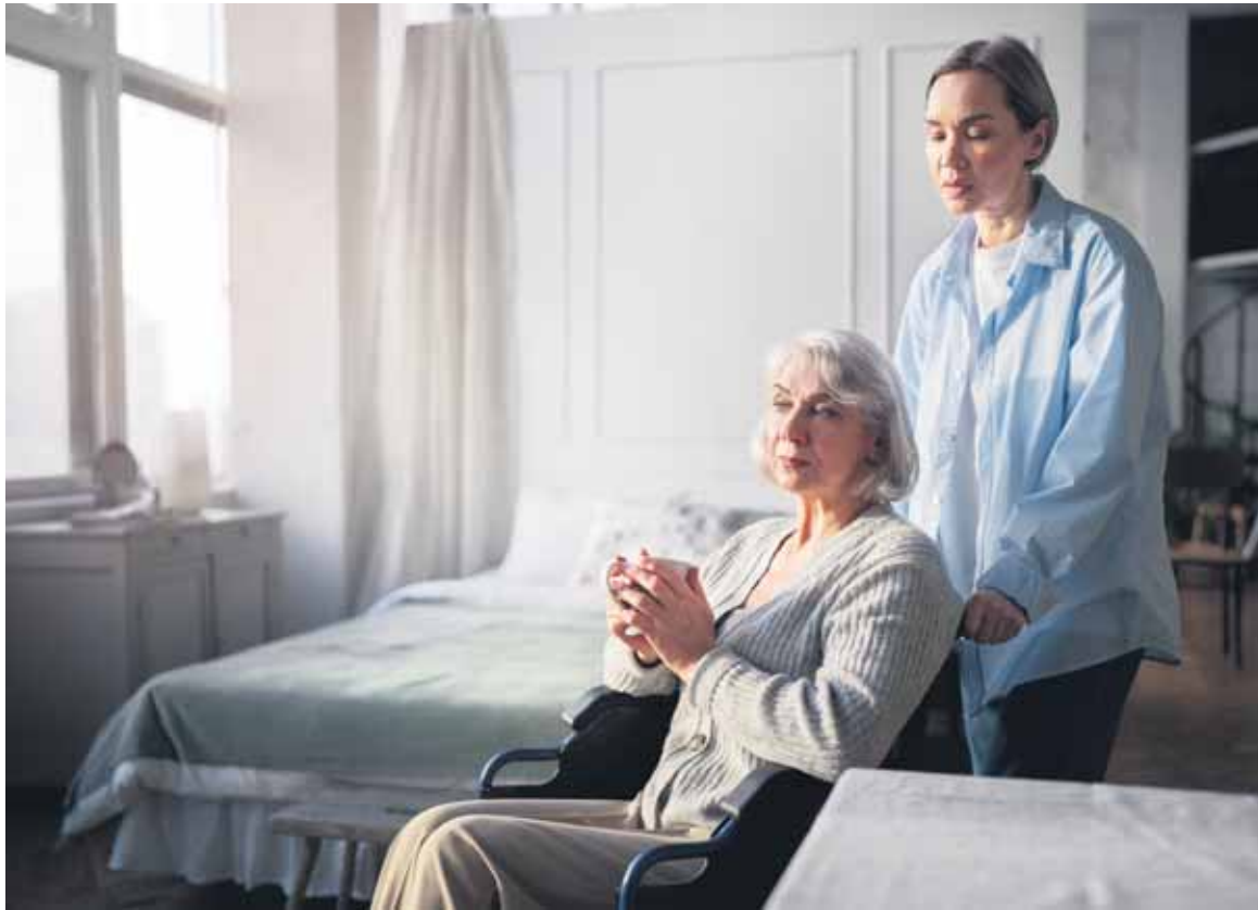
Las residencias trabajan con una materia prima muy sensible: las personas.

LA PATRONAL Y LOS SINDICATOS NEGOCIAN EL IX CONVENIO MARCO ESTATAL DE LA DEPENDENCIA CON EL OBJETIVO DE CONSEGUIR CONDICIONES MÁS FAVORABLES PARA LOS TRABAJADORES QUE PERMITAN MITIGAR LA FALTA DE PERSONAL QUE SUFRE EL SECTOR