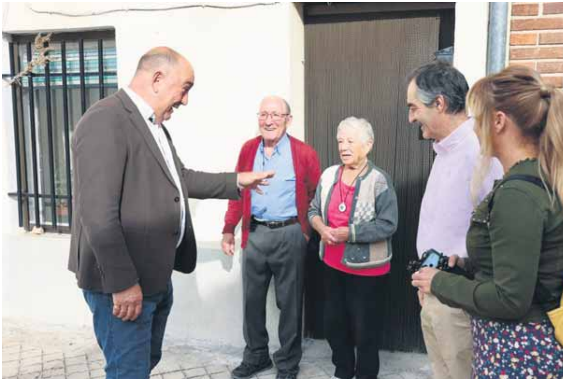
El presidente de la Diputación, Miguel Angel de Vicente, con participantes del programa. DIPUTACIÓN DE SEGOVIA