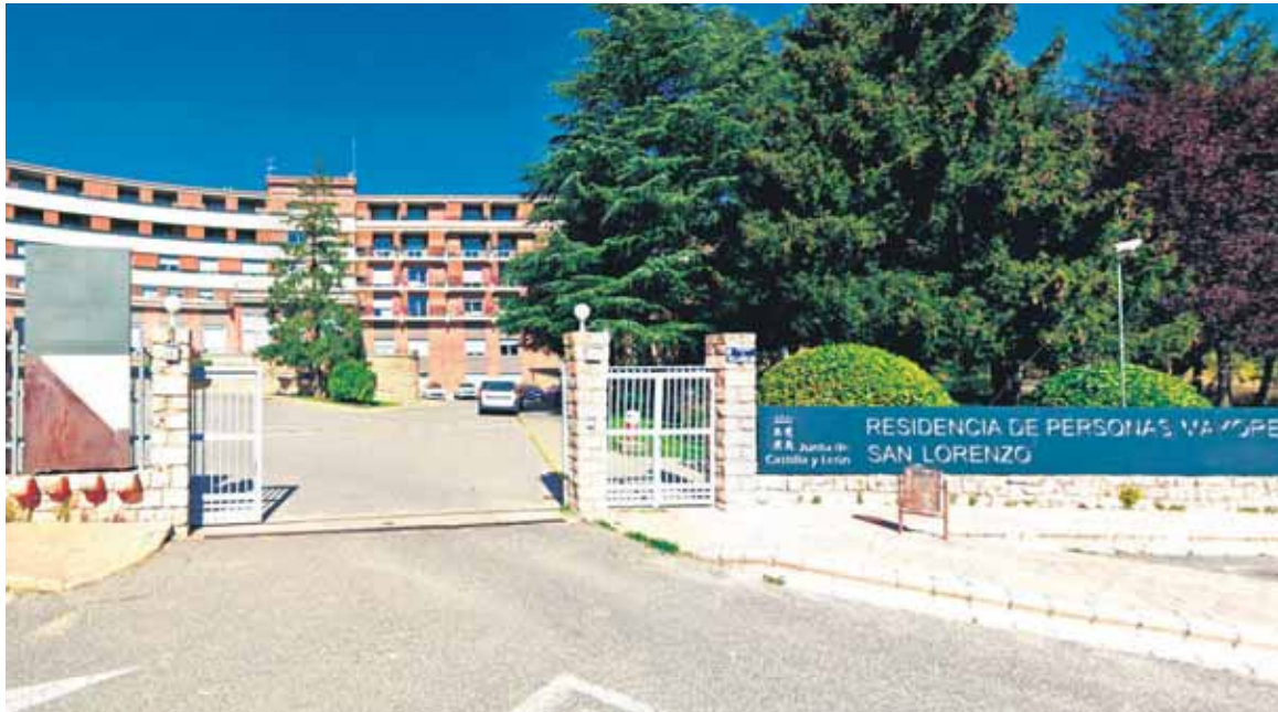
Residencia mixta de San Lorenzo, en Segovia.

EL PRECIO MEDIO DE UNA RESIDENCIA PRIVADA EN SEGOVIA ES DE 1.613 EUROS AL MES, 505 EUROS MENOS DE LA MEDIA NACIONAL QUE SE SITÚA EN LOS 2.118 EUROS AL MES, TAN SOLO POR ENCIMA DE SORIA Y CÁCERES. LOS PRECIOS MÁS CAROS ESTÁN EN ÁLAVA, CON 2.617 EUROS AL MES DE MEDIA