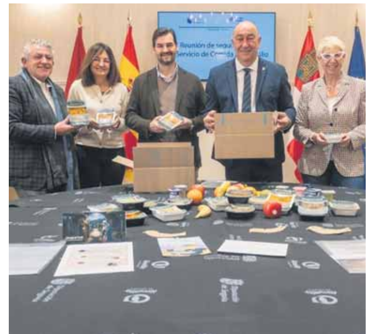
Imagen del programa de 'Comida a Domicilio'.

Se ofrecen más de 30 tipos de dieta (diabética, baja en sodio, fácil masticación, renal, celíaca, alergias, etc.). Los platos se envasan sin conservantes ni gases, en recipientes aptos para microondas y 100% reciclables, con etiquetado informativo. Además, hay orientación nutricional, trazabilidad en tiempo real, encuestas trimestrales y reparto organizado en seis rutas. En 2025 se distribuyeron casi 111.000 menús; la mayoría de usuarios se concentró en Cuéllar (187) y Cantalejo (168).