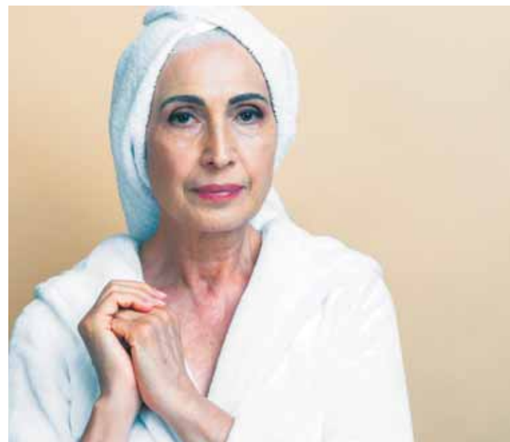
20.000 familias se beneficiarán de las ayudas para poner platos de ducha.

En este contexto, ha señalado que con esta medida la Junta pretende ayudar a 20.000 familias al año mediante la sustitución de bañeras por platos de ducha. "Para que tengan una vida más fácil, para que tengan más autonomía, para que puedan seguir viviendo en su casa y para evitar el riesgo de las caídas en uno de los lugares domésticos más comprometidos", ha apostillado.