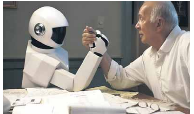
Fotograma de la película “Un amigo para Frank”.

El último en llegar es Arkeo, un robot humanoide desarrollado por la startup catalana Arkeobots. Con cara expresiva y voz juvenil, está pensado para acompañar a mayores en hogares y residencias: conversa, detecta emociones, propone actividades, recuerda citas médicas y facilita el contacto con la familia a través de llamadas y mensajes. Todos estos proyectos comparten una misma promesa: estar “ahí” cuando no hay nadie más, vigilar la