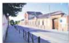
'Residencia El Mirador de Coca' Coca (Segovia) - Tel. 921 586 407