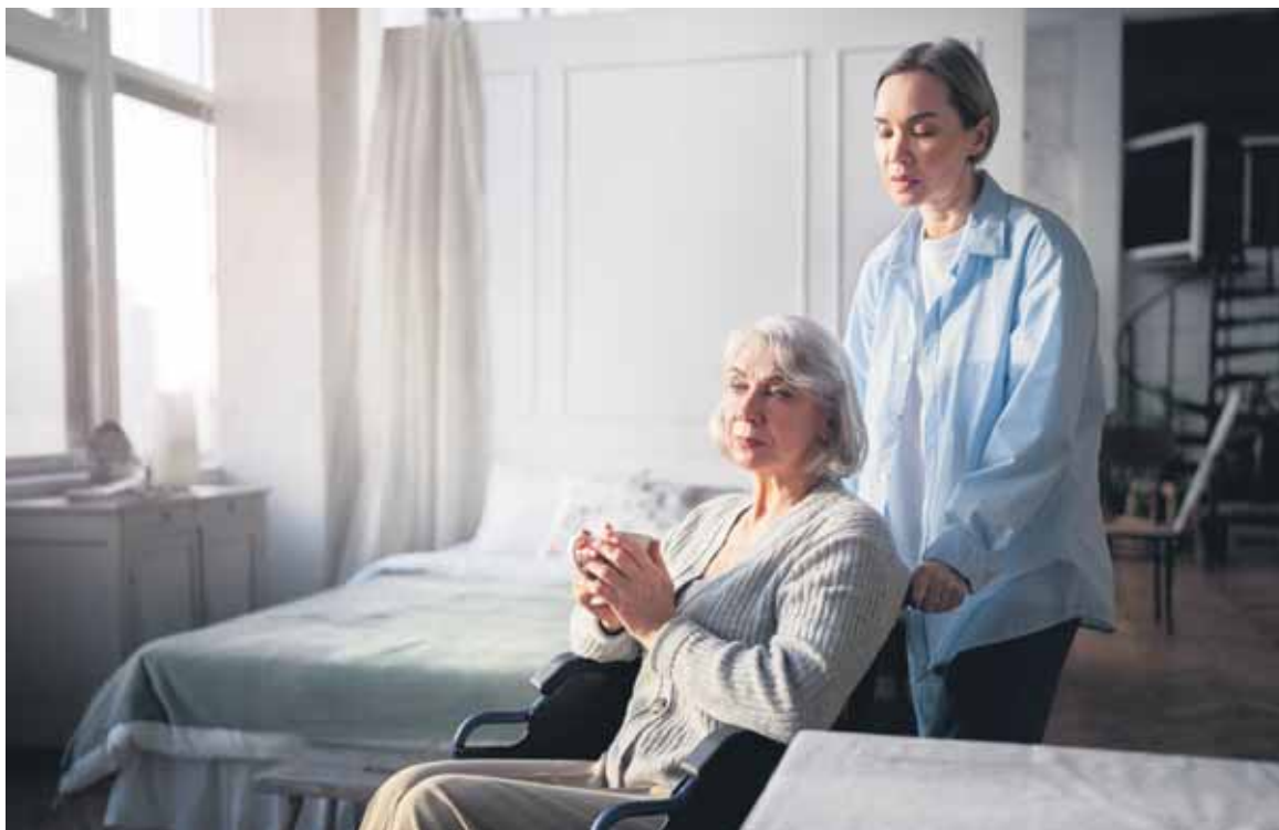
La falta de personal es el problema más acuciante al que se enfrentan las residencias.