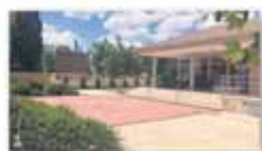
'Nuestra Señora Virgen del Rosario' Sanchonúño (Segovia) - Tel. 921 160 093