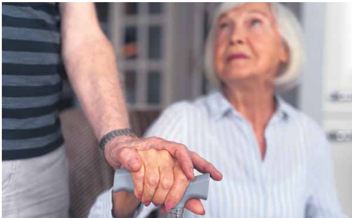
Cerca de 8.000 personas se encuentran en lista de espera para acceder a las ayudas en Castilla y León.