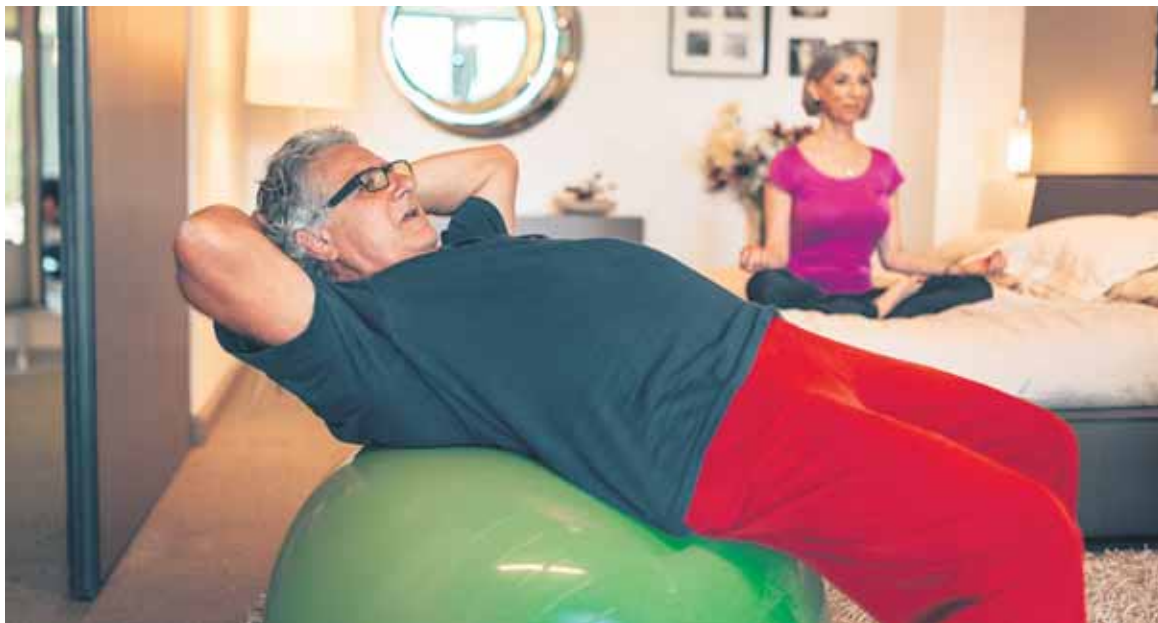
Las aplicaciones personales de entrenamiento proliferan en las plataformas digitales.

DESDE APLICACIONES QUE FUNCIONAN COMO ENTRENADORES PERSONALES A TEST DE ORINA PARA DETECTAR EL CÁNCER DE PRÓSTATA, LA INDUSTRIA DEL ENVEJECIMIENTO SE ABRE CAMINO CON FUERZA EN ESPAÑA