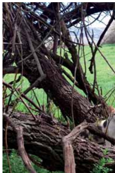
La Sociedad Protectora de Animales y Gescofes reciben los fondos del Ayuntamiento.