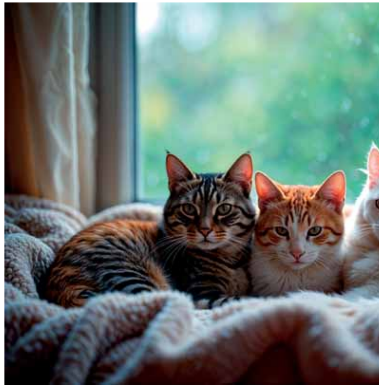
La comida de los perros supone gastos de entre 300 y 900 euros al año, según el tamaño del animal. Los gatos son más frugales, y gastan en comida entre 125 y 300 euros al año.