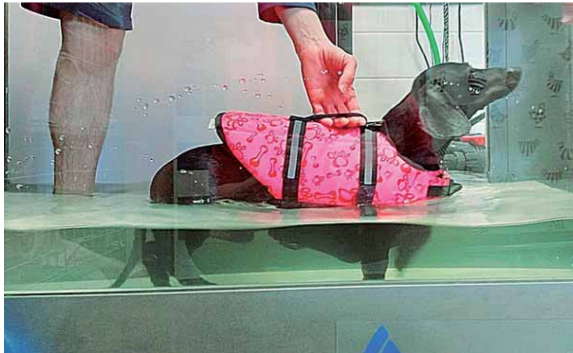
Un perro realizando hidroterapia de rehabilitación en el Centro Veterinario Uno + de la Familia.