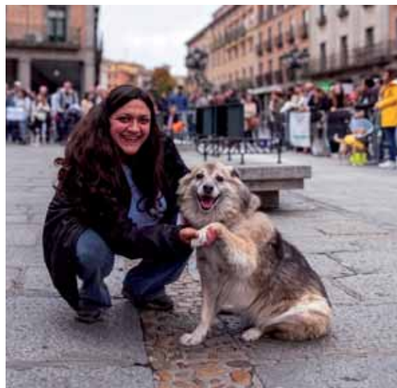
Cumplir la normativa permite una convivencia sana entre vecinos y propietarios.