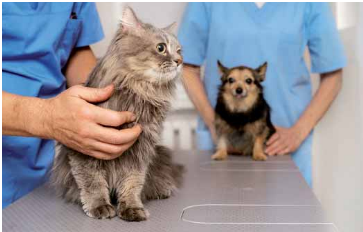
La visita al veterinario asegura la salud de tus animales de compañía y previene problemas mayores.