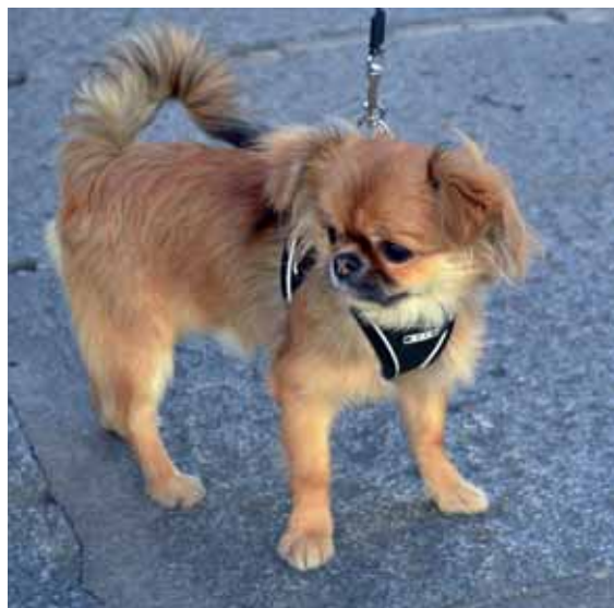
PROTECTORA DE ANIMALES

más una escena demasiado frecuente en verano: nada de dejar animales al sol sin protección o dentro de vehículos donde puedan asfixiarse.