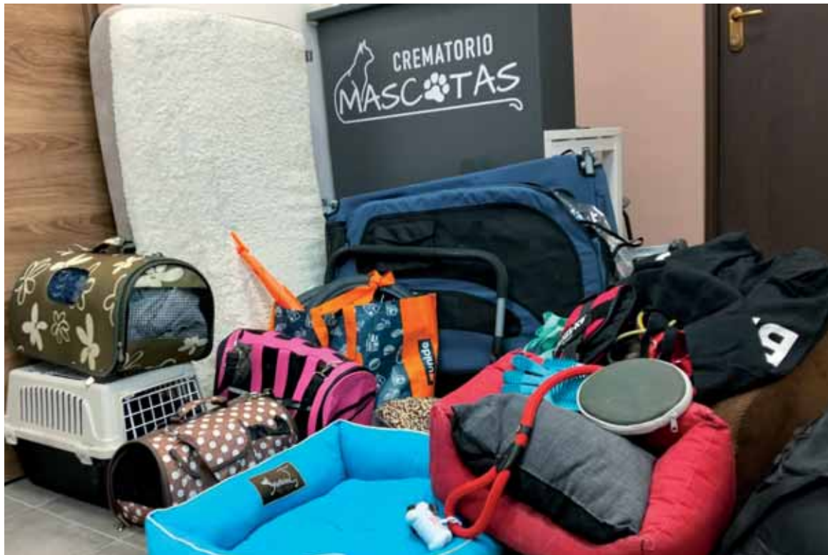
La iniciativa de Fuentebet permite que el vínculo con el animal de compañía continúe.