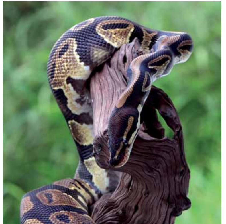
El galápago de Florida y la serpiente pitón real son especies invasoras, y por lo tanto está prohibido su tenencia y cría en los domicilios.