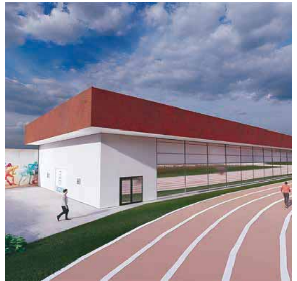
Los proyectos de la urbanización de Las Lastras así como el módulo cubierto de atletismo serán algunos de los proyectos que deben avanzar decisivamente en 2026.