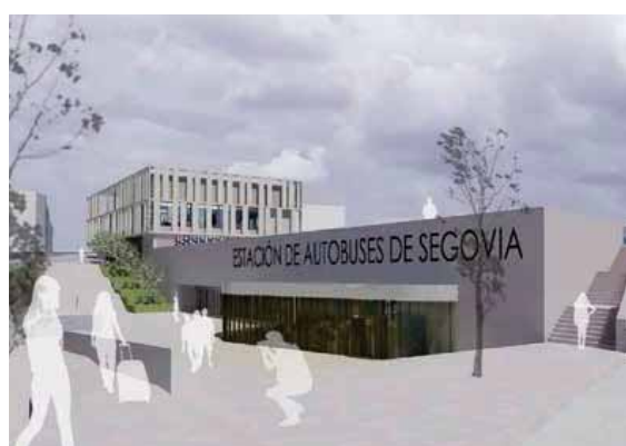
El centro de salud Segovia IV actualmente. Derecha arriba, viviendas para alquiler joven. Abajo, el problema del suelo retrasa la nueva estación de autobuses.