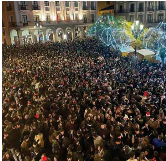
En los últimos años la Plaza Mayor y las calles de sus alrededores congregan a miles de ciudadanos durante la tarde del 24 de diciembre animados por DJ de distintos estilos.