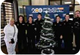
POLICÍA NACIONAL COMISARÍA DE SEGOVIA

PERSONALIDADES DE LA VIDA POLÍTICA, ECONÓMICA, CULTURAL Y SOCIAL SEGOVIANA ESCRIBEN SU PARTICULAR CARTA A LOS REYES MAGOS PARA QUE EN 2026 MEJOREN ALGUNOS DE LOS PROBLEMAS QUE SUFREN HOY LOS CIUDADANOS