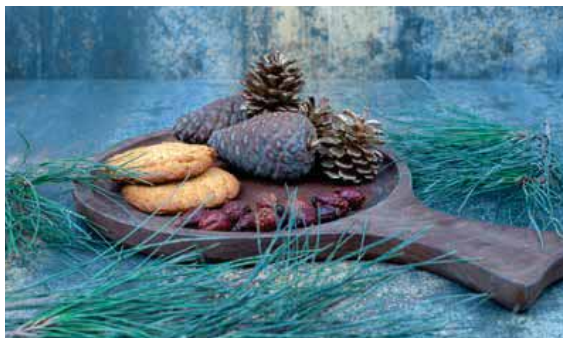
Para Nochebuena y Navidad se llevan los motivos naturales y las copas de color. En Nochevieja predominan los dorados y negros.