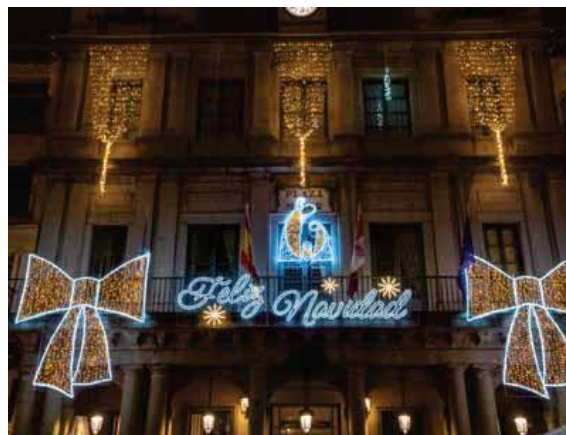
Arriba, Portal de la Navidad y Avenida del Acueducto. Abajo, mercado navideño, quiosco de la Plaza Mayor y fachada del Ayuntamiento.