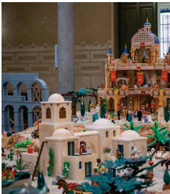
Belén del convento de Santa Clara en Cuéllar. Abajo, el de la Diputación.

cioso Belén que monta cada año la Asociación Familiar San Antonio.