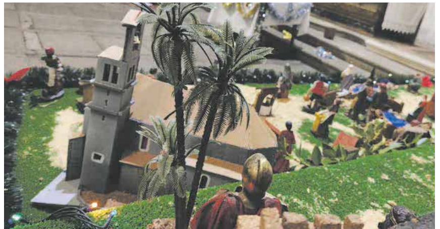
Arriba, detalle del belén expuesto en la iglesia de Los Dolores de la Granja. Derecha, belén de la Alhóndiga. Abajo, belén del Torreón de Lozoya y el expuesto en Otero de Herreros.

Los belenes tradicionales tienen algo que alimenta el espíritu navideño, una armonía vital que se transmite de las figuras al espectador. No está de más recordar que esta fiesta empezó con un niño en un pesebre y no con el último anuncio de un centro comercial.