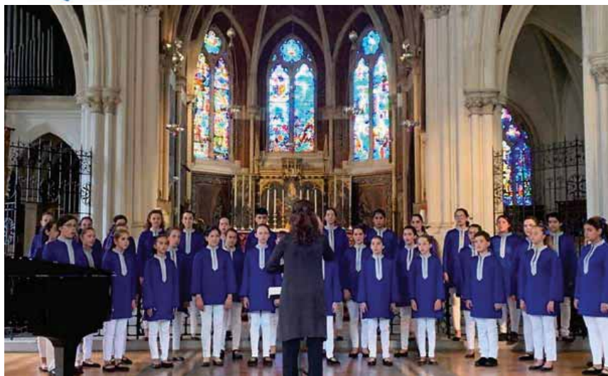
La banda musical La Unión realizará varios pasacalles musicales durante estas fechas. A la derecha la Escolanía de Segovia, que actuará en el trascoro de la catedral.

ta la Plaza Mayor, como si quisieran recordarnos que la Navidad no es un decorado sino una banda sonora.