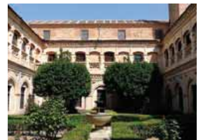
Arriba, una capilla de la Catedral e Iglesia de la Vera Cruz. Abajo, Monasterio de El Parral, San Millán, Palacio Episcopal y San Antonio El Real.

del obispo Manuel Murillo y Argaiz mediante gafas especiales y deben resolver un misterioso suceso acaecido en los muros del palacio. El precio del escape room es de 25 euros por persona. El Palacio cierra el 24, 25 y 31 de diciembre y el 1, 5 y 6 de enero.