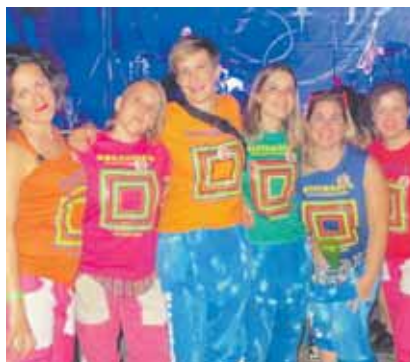
Quien no se divierta en Bernuy de Porreros estos días es porque no quiere.