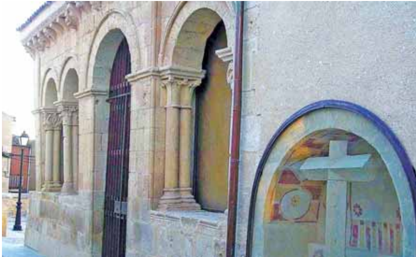
Iglesia de Santiago Apóstol.

LAS COFRADÍAS DE SANTIAGO Y SAN JOSÉ TIENEN VARIOS SIGLOS DE HISTORIA Y TODAVÍA MANTIENEN VIVOS LOS RITOS RELIGIOSOS