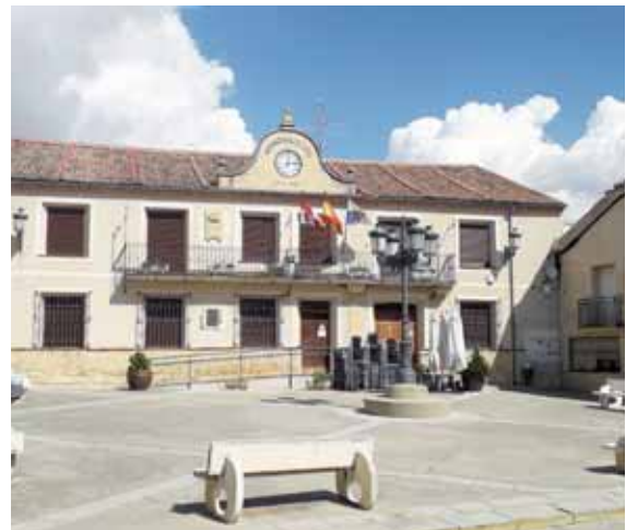
Ayuntamiento de Bernuy de Porreros.

Bernuy es una localidad tranquila, bien comunicada, con servicios básicos y acceso a una de las infraestructuras ferroviarias más potentes de Europa. Si el crecimiento sigue su curso y el plan de vivienda regional logra acompañarse al ritmo de la demanda, Bernuy de Porreros puede convertirse en la norma de un nuevo modelo residencial.