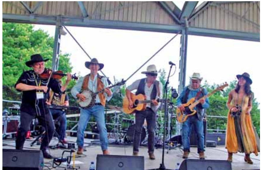
El grupo Clan Makeihan ofrecerá un concierto de música country en las Fiestas.

DEL 23 AL 27 DE JULIO BERNUY DE PORREROS CELEBRA SUS FIESTAS EN HONOR A SANTIAGO, UNA EXCUSA IDEAL PARA CONOCER LA LOCALIDAD Y SUS ALREDEDORES