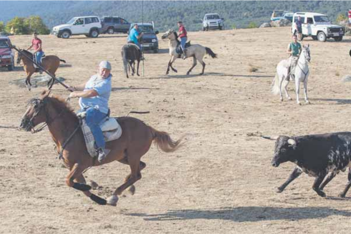
Los encierros camperos tampoco faltarán este año en Valsaín.