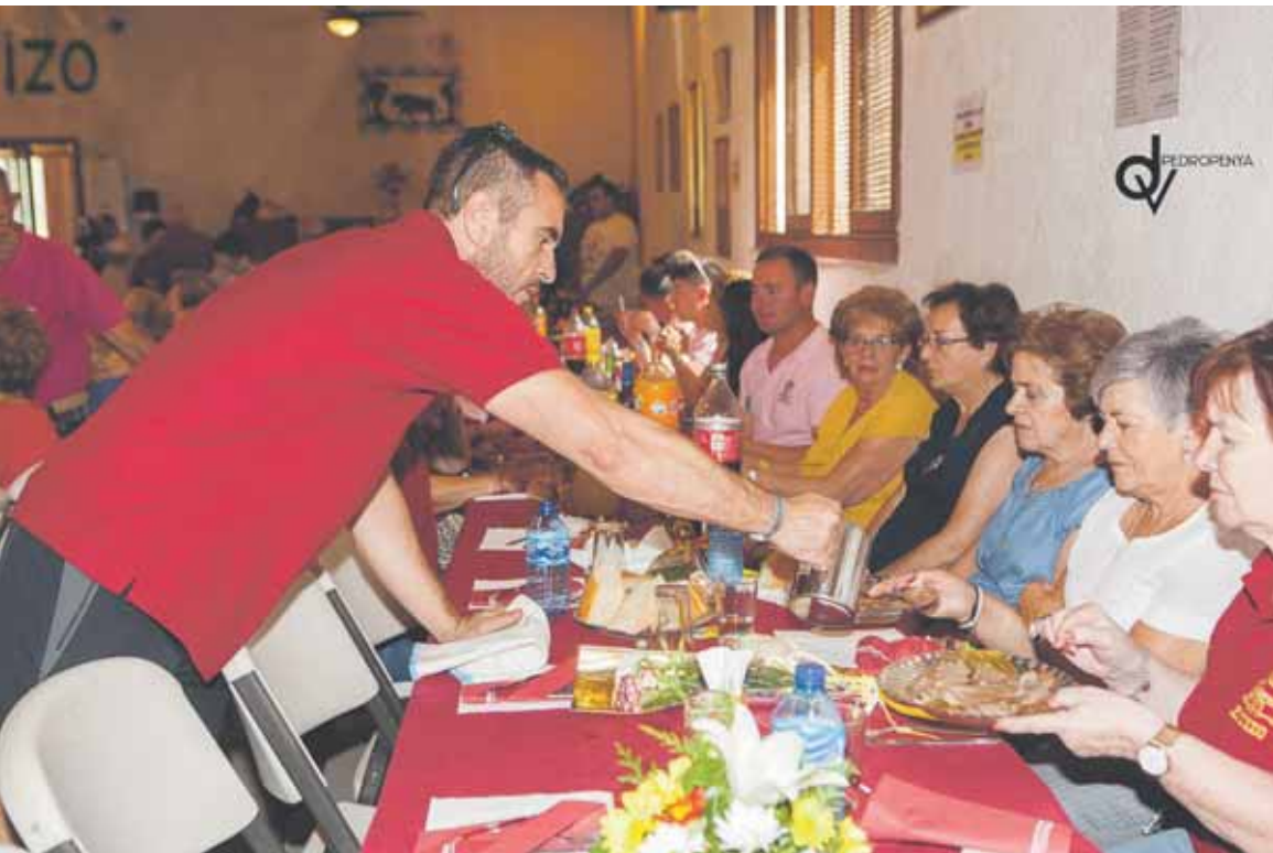
Los mayores están invitados al homenaje que todos los años organiza 'El Tizo'.

nocer. Según explica Pedro de la Peña en 'Crónicas Gabarreras', la corta de troncos ('aizkona' en vasco) consiste en un desafío de 'aizkolaris', atletas que compiten en el corte de un determinado número de troncos de árboles, de un grosor previamente pactado. Normalmente estos troncos son colocados en tierra y sujetos al suelo mediante carriles de madera, de modo y manera que cada fila de troncos quede dividida en dos calles por las que cada competidor discurrirá efectuando los correspondientes cortes.