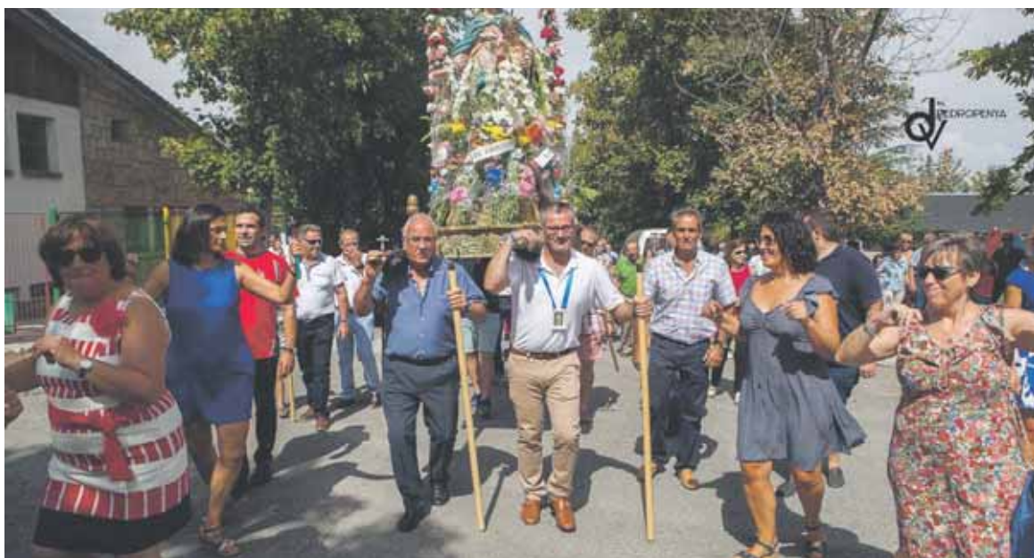
Los vecinos celebrarán la misa y la tradicional procesión con la imagen de la Virgen.

EN PLENO PARQUE NACIONAL Y RESERVA DE LA BIOSFERA, LOS VECINOS DE VALSAÍN ESTÁN PREPARADOS PARA UNOS FESTEJOS POR TODO LO ALTO TRAS DOS AÑOS DE PARÓN