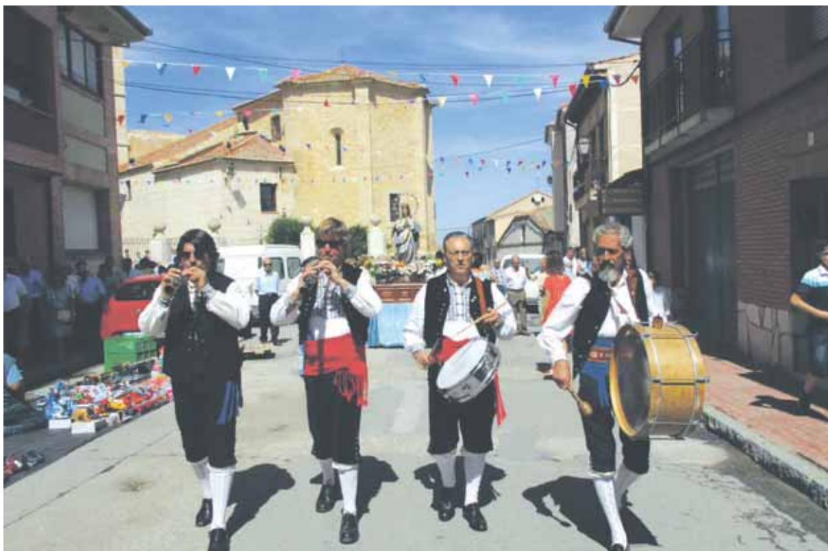
Procesión de la patrona por las calles del municipio

EL MUNICIPIO DE CANTIMPALOS YA TIENE TODO PREPARADO PARA CELEBRAR A SU PATRONA Y RETOMAR CON LAS ACTIVIDADES FESTIVAS QUE TANTO GUSTA AL PÚBLICO