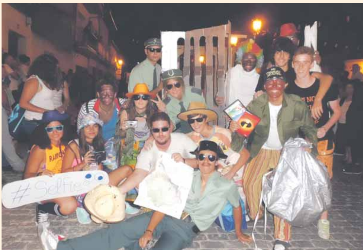
Fotos de ediciones pasadas de las Fiestas Patronales de Cantimpalos.