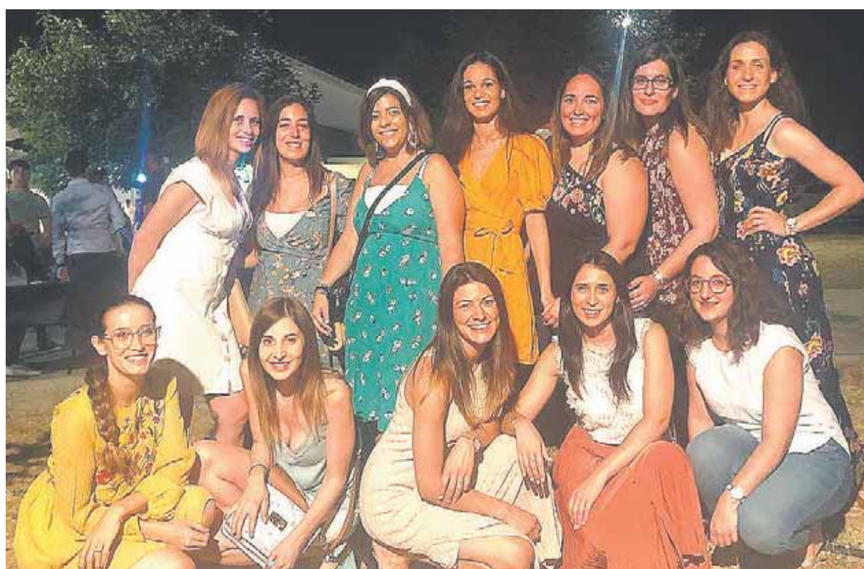
La peña Las Cachondas están encargadas de hacer el pregón de este año.

—¿Cuál es el acto que más espera el alcalde?