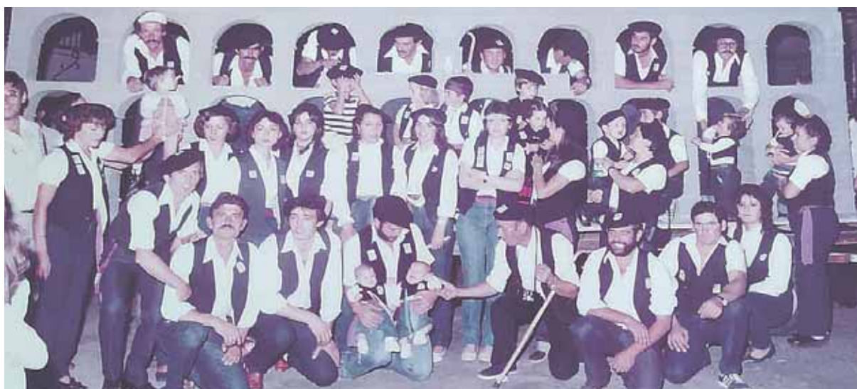
Una foto de ediciones pasadas de las fiestas con la presencia de la peña.

Una parte fundamental de las fiestas de los pueblos son las peñas. Estas agrupaciones nacen de los quintos y salen a festejar en grupo por las calles de su municipio. Estas agrupaciones cargan con un peso importante, el de animar las fiestas, no solo se encargan de que haya un ambiente festivo, sino muchas veces son ellos los que organizan actividades o contratan a grupos de música para el disfrute de todos. Debido a su gran papel durante las épocas festivas en algunos