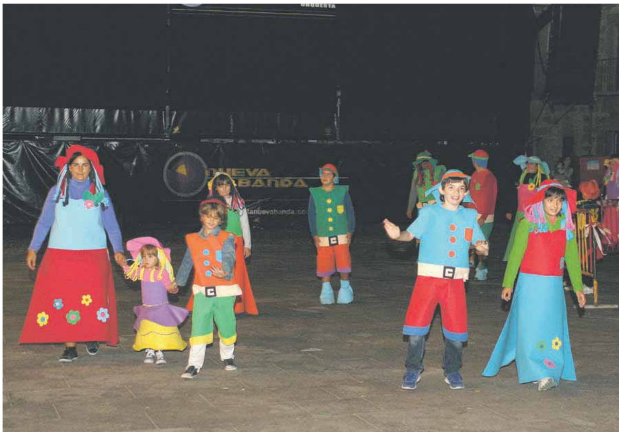
Una de las actividades más destacables según la líder de esta agrupación es el desfile de disfraces.