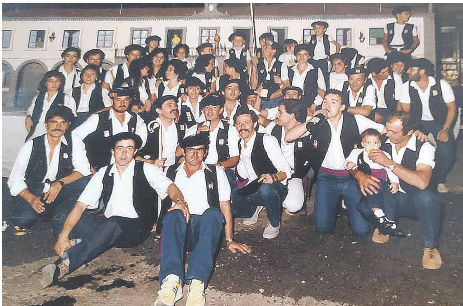
La peña el Pato Negro en sus primeras ediciones de estas fiestas como una agrupación.

momentos muy emotivos y tradicionales que son la misa solenne y la ofrenda de flores que se hace a la Virgen del Carrascal y al patrón San Sebastián, “creo que estos momentos es donde más se refleja la tradición religiosa que hay en nuestro municipio y es muy destacable”, señala Garcinuño.