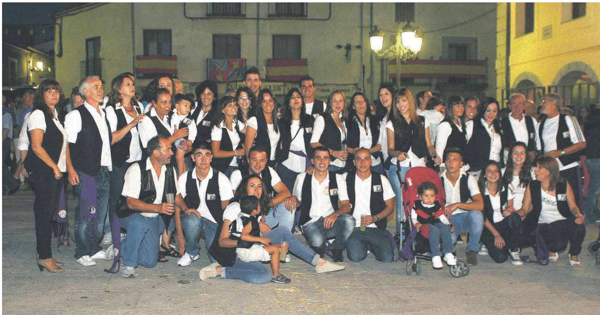
La peña El Pato Negro celebró su cincuenta aniversario en el 2020, pero solo lo podrá celebrar hasta ahora tras dos años de pademia

UNA DE LAS PEÑAS MÁS TRADICIONALES DEL MUNICIPIO ESTA ENCARGADA DE CELEBRAR EL PREGÓN QUE INDICAN QUE LAS FIESTAS EN VILLACASTÍN HAN VUELTO DESPUES DE DOS AÑOS DE PARÓN