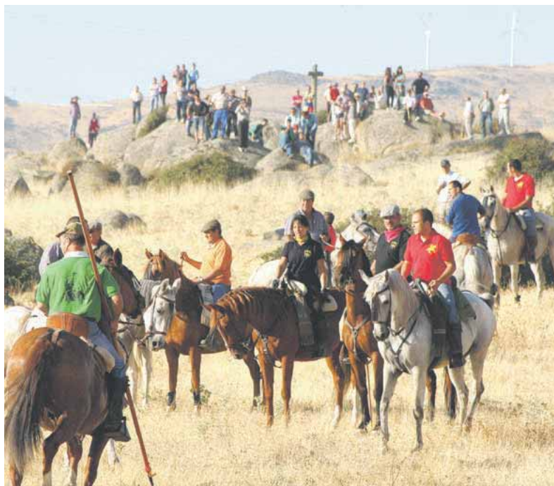
Uno de los grandes atractivos de la programación es el encierro.

VILLACASTÍN SE PREPARA PARA CELEBRAR A SU PATRÓN DURANTE TODA UNA SEMANA