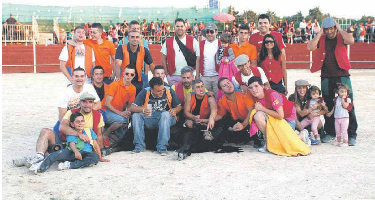
Las peñas ya están listas para salir a festejar y realizar muchas actividades.

grafías de una artista local bajo el nombre “Guerreras de Villacastín” que retratan a mujeres de Villacastín en diferentes épocas, y como toque final han puesto una imagen de todas las mujeres mayores de Villacastín porque ellas son las auténticas guerreras de este municipio.