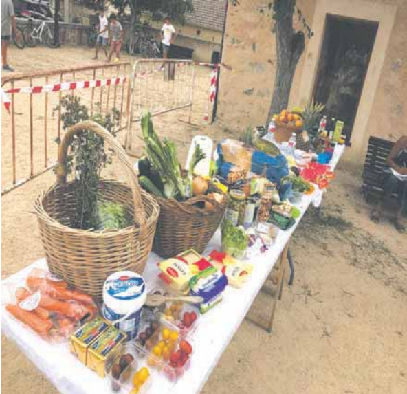
Dentro actividades más destacables de las fiestas de Navas de Riofrío están las comidas, los actos religiosos y toros.

personas este año quieren salir y quieren festejar”, continua la alcaldesa.