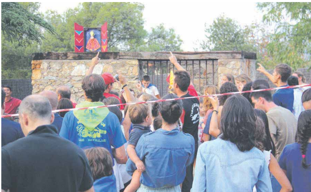
Los navilleros festejan a su patrón el día dos de septiembre.

EL MUNICIPIO SEGOVIANO AFRONTARÁ ONCE DÍAS DE FIESTA HASTA EL PRÓXIMO 5 DE SEPTIEMBRE EN DONDE SE LLEVARÁN A CABO MÚLTIPLES ACTIVIDADES DE DIVERSA ÍNDOLE PERO EN LAS QUE TIENE GRAN IMPORTANCIA LA RELIGIÓN