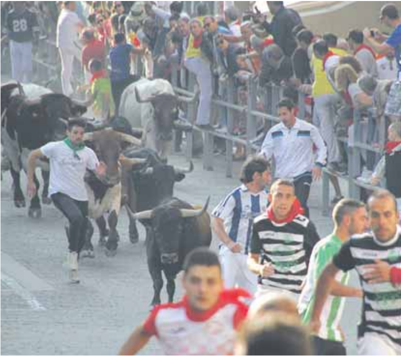
La suelta de novillos es la respuesta a muchos aficionados taurinos. C.N.

Otra de las polémicas que han saltado sobre esta gran novedad es llamarlo encierro, para algunos en detrimento del tradicional matutino, desde los corrales hasta la Plaza de Toros. “Se ha denominado encierro porque así lo recoge el Reglamento de Festejos Taurinos Populares de Castilla y León; realmente es una suelta de novillos desde la Plaza de Toros hasta San Francisco, porque encerrar no se encierra”, explica Carlos Fraile. Asegura que la motivación es dar contenido taurino a una tarde en la que se ha suprimido un festejo por falta de asistencia ante un vermouth muy potente. “Este debate lleva abierto en Cuéllar más de 15 años y queremos propiciar movimiento, que la gente salga de sus casas y genere actividad económica tanto en la hostelería como en las ferias”, añade el alcalde de la localidad. Para Carlos Fraile y su equipo, está claro cuál es la tradición de la villa: “lo tenemos tan claro que hay un encierro más”, en referencia al del 1 de octubre por la festividad del patrón San Miguel. “Conocemos cuál es su historia, nuestro elemento diferenciador con otras localidades, ese recorrido de campo entre pinares y rastrojera”, indica Fraile hablando de “esencia y