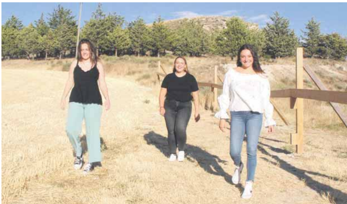
Corregidora y damas pasean por El Embudo, junto a los palos que delimitan la entrada de los toros.