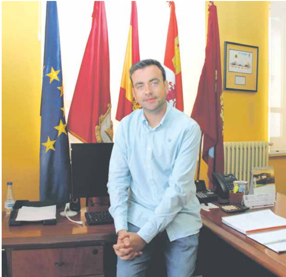
El alcalde en su despacho del Ayuntamiento de Cuéllar.

— Se ha apostado por un elenco que está en las principales ferias de España, Francia y Portugal, eso es una cuestión objetiva, y es que además entendemos que debe ser así. Si estamos diciendo que a nivel de títulos, Cuéllar tiene el encierro más antiguo de España y declarado de Interés Turístico Internacional, si tenemos este producto turístico, tenemos que apostar por introducir una serie de componentes a la altura de ese tipo de declaración. Además no son estas cuestiones, es que el encierro de Cuéllar es único, es donde está la esencia de la palabra “encierro”: encerrar las reses que van a ser lidiadas en la