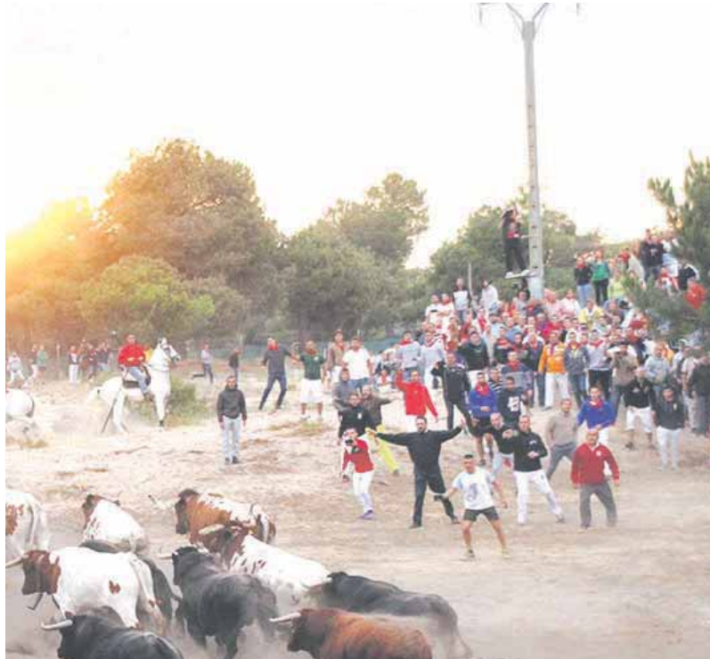
Instantes de la suelta de los corrales de 2019.

algo. Estos dos años han sido muy difíciles, muy tristes, muy tediosos. Hemos tenido sentimientos encontrados en muchas ocasiones