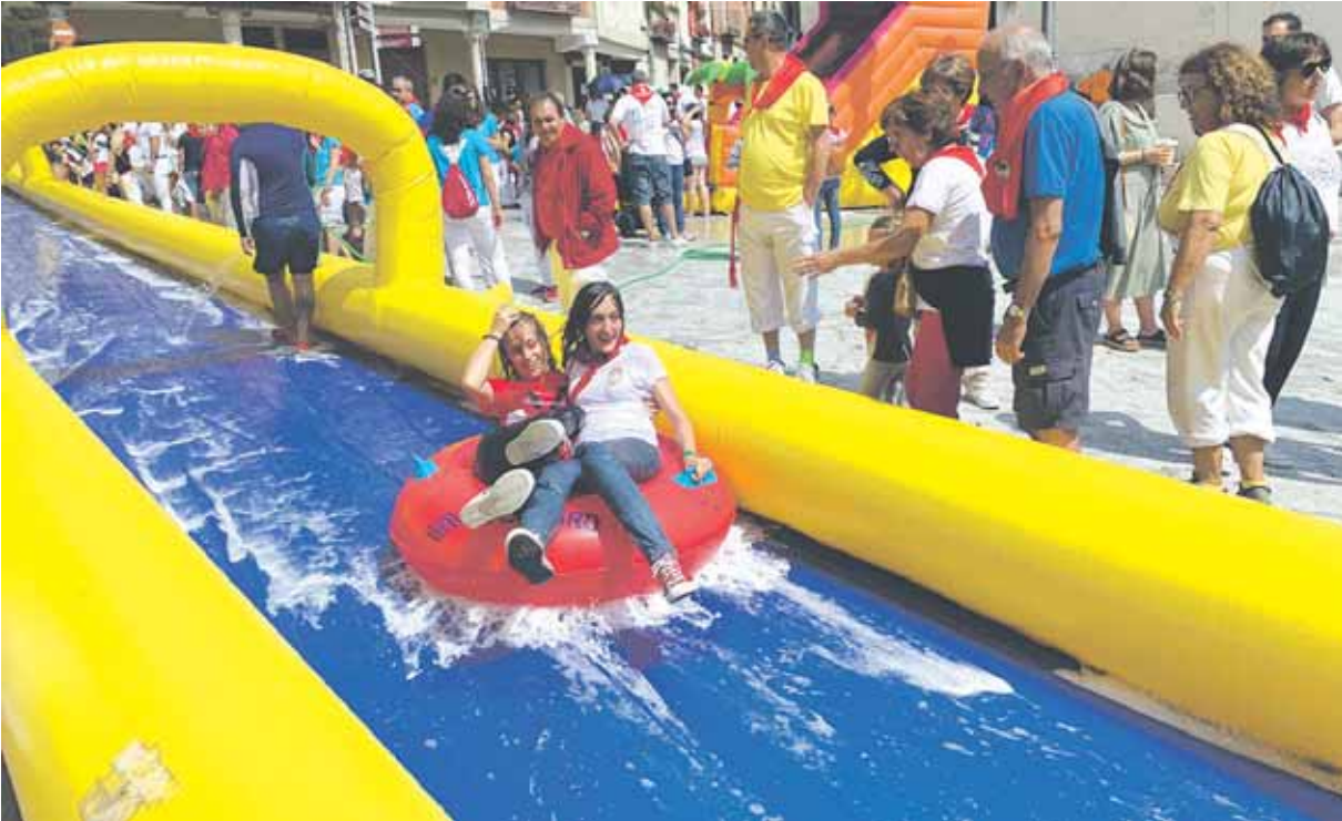
Las peñas son fundamentales en el ambiente de la localidad, creadoras de un sinfín de actividades.

CUÉLLAR VUELVE CON FUERZA, CON UN PROGRAMA DE MÁS DE 60 ACTIVIDADES QUE PRETENDE HACER DISFRUTAR A TODOS LOS VECINOS Y VISITANTES DESDE EL PRIMER AL ÚLTIMO DÍA DE LAS FIESTAS EN HONOR A NUESTRA SEÑORA DEL ROSARIO