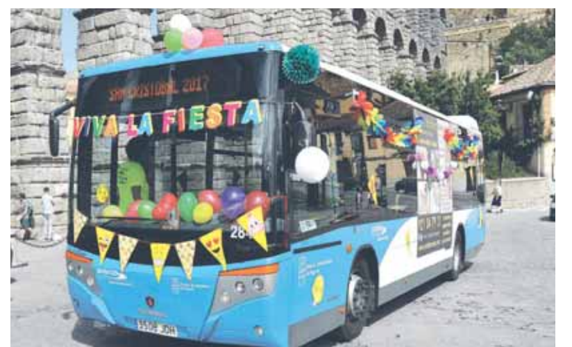
Instantáneas de otras ediciones de la celebración de San Cristóbal.

ta Segovia y al finalizar se hará entrega del Premio 'Juan Antonio de la Calle Fernández' a los vehículos mejor adornados.