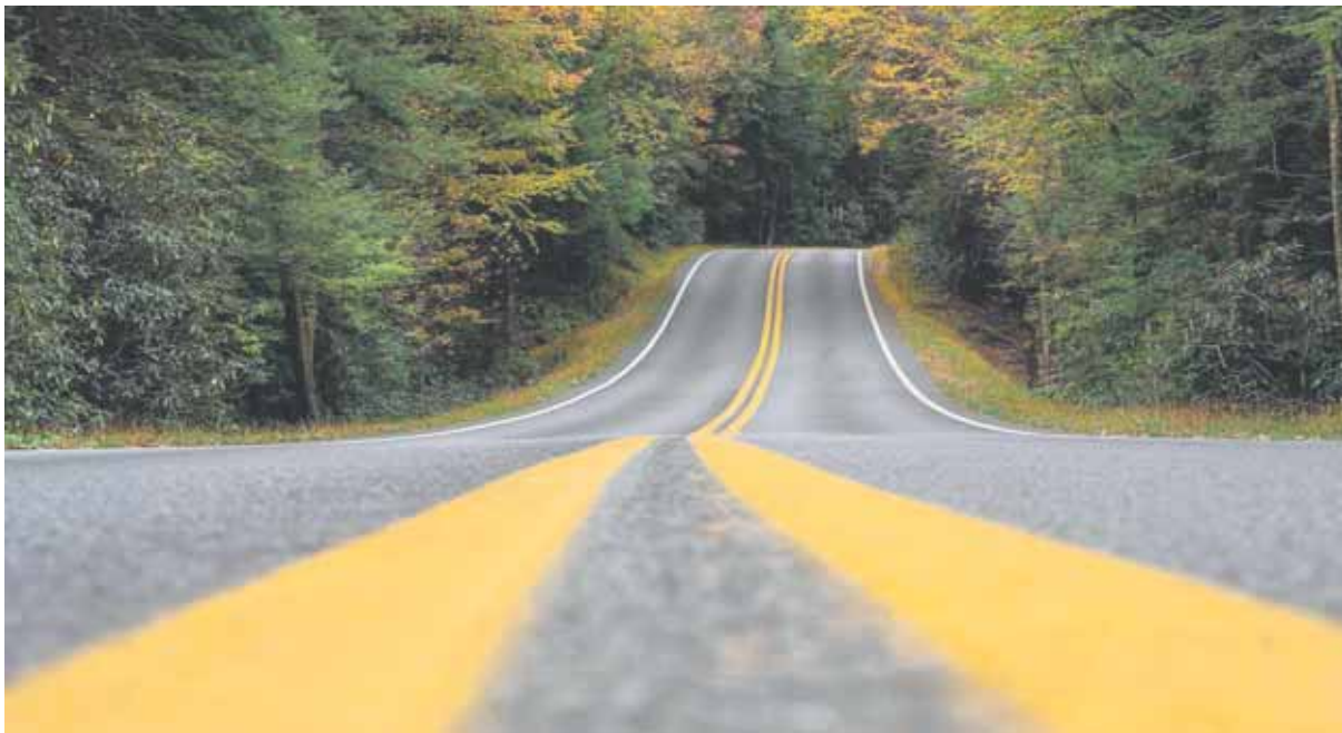
El objetivo esencial de Semutransa es dar un servicio auxiliar a los transportistas profesionales.

sionales, todos los días del año. Nuestra sociedad nació con un único objetivo, servicio a los transportistas segovianos, y ese es nuestro empeño constante.